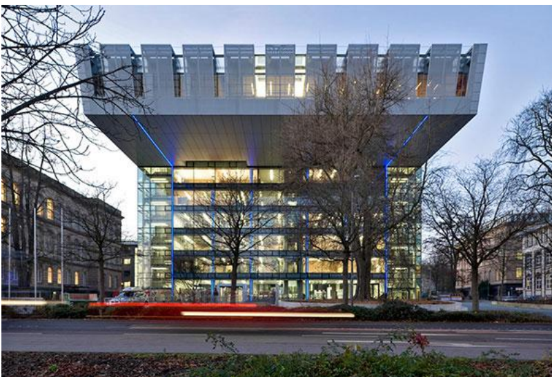
Super C der RWTH