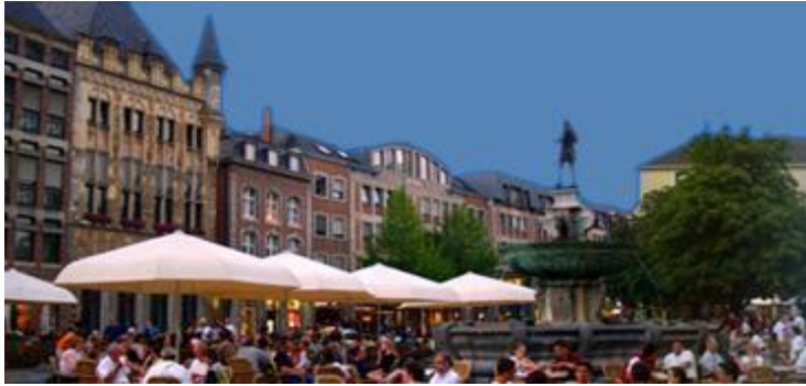
Platz vor Rathaus Restaurant Goldener Schwan ganz links im Bild