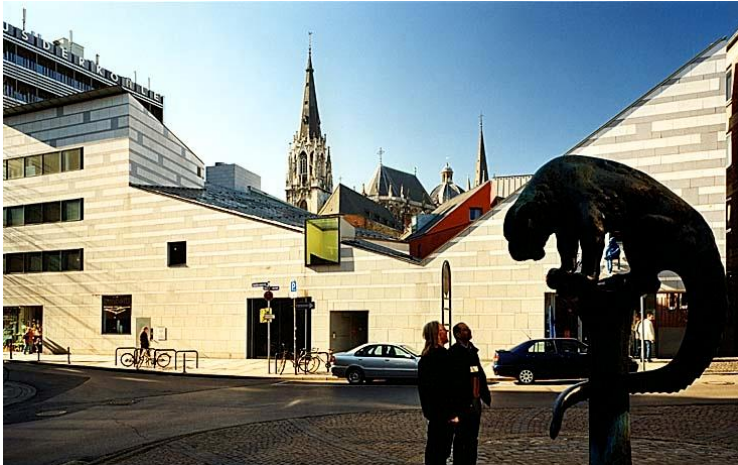
Sogenanntes Aachener Fenster direkt gegenüber vom Hotel Kirchturm links: St. Foillan, Kuppel rechts: Dom